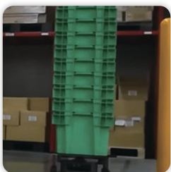
倉庫内の運搬作業