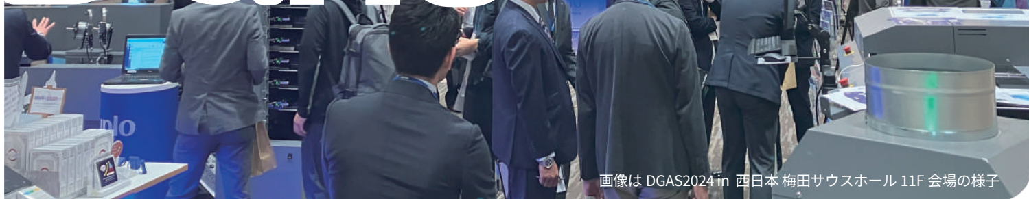
画像は DGAS2024 in 西日本 梅田サウスホール 11F 会場の様子